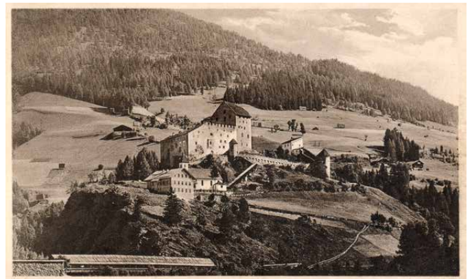
Burg Heinfels um das Jahr 1910