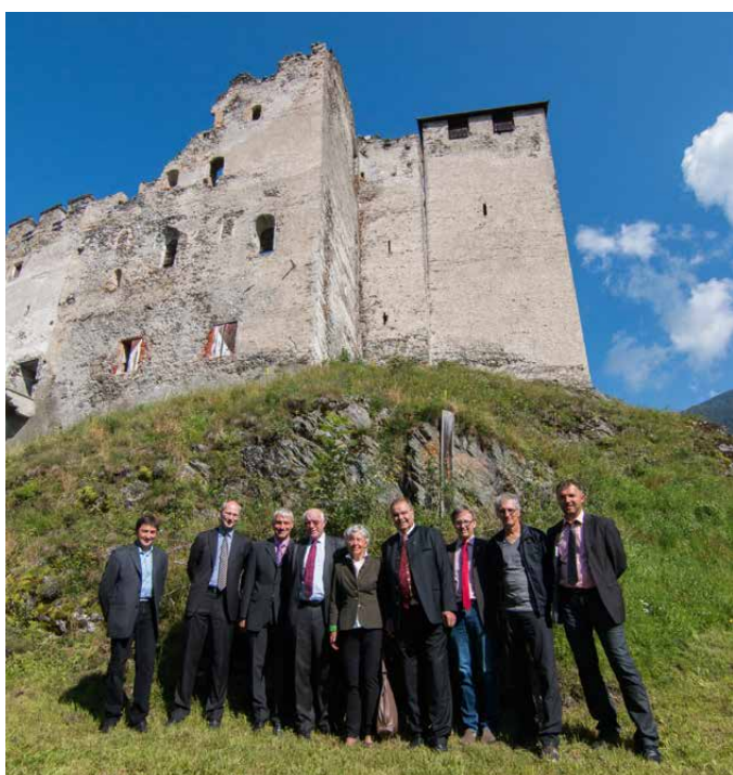
Der Museumsverein Burg Heinfels hat es sich zur Aufgabe gemacht, das Wahrzeichen des Hochpustertales zu sanieren und einer Nutzung zuzuführen.