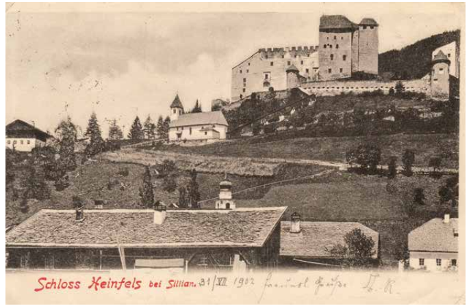
Postkarte aus dem Jahre 1902

Nach dem Aussterben der Görzer Grafen um 1500 gelangte Heinfels mit der gesamten Herrschaft an Kaiser Maximilian I. Von 1654 ist 1783 befand sich die Burg im Besitz des königlichen Damenstiftes in Hall und wurde danach